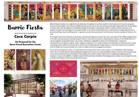
Image Captions: mga sampol ng dating nilikhang sining at malapitang istilo ng pagpinta halimbawa ang gym pag tiningnan ito mula sa lansangan ng 6th at Folsom; mga inspirasyon mula sa mga tela ng Pilipinas; Mga napapanahong Barrio Fiesta sa distrito ng SF SOMA: hindi pa natutuklasang (Undiscovered) SF; ang likhang sining sa dingding ng gym na nakaharap sa hilaga

Dahil sa laki at disenyo ng gusali, balak ng disenyo sa likhang sining na ito na gamitin ang lahat ng lugar na magagamit para mas mas malakas ang dating nito at para mas lalo pang makita ito. Ang gusali ng Gene Friend na maaaninag sa background ay sumasalamin at pinagsasama sama ang masisiglang gawain sa loob at labas ng sentro.